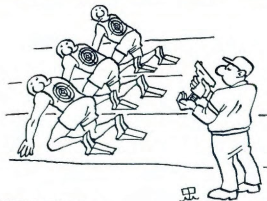
М. ФЕДОРАХИН, г. Ташкент.